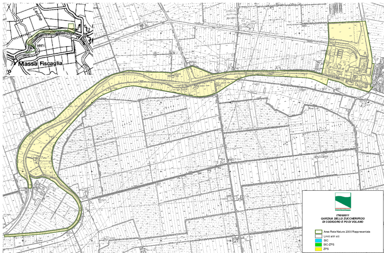
Figura 2-2: Perimetro della ZPS IT4060011

L'area di riferimento della garzaia è posizionata nella porzione nord del territorio comunale lungo il Po di Volano. Si riporta un estratto della cartografia scaricabile da https://ambiente.regione.emilia-romagna.it/it/parchi-natura2000/rete-natura-2000/siti/it4060011