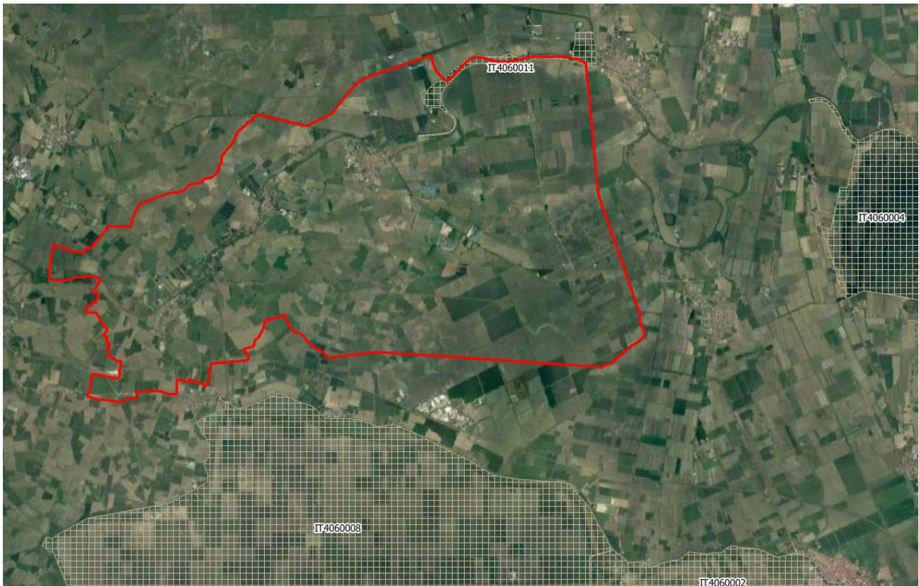
Figura 2-1: Posizione di Fiscaglia rispetto ai siti della Rete Natura

Inoltre a sud, esternamente a Fiscaglia ed entro i confini dei comuni di Argenta, Comacchio, Ostellato, Portomaggiore è presente il sito IT4060008 – ZPS -Valle del Mezzano, che si trova nei comuni di Argenta, Comacchio, Ostellato, Portomaggiore e ricada parzialmente nel Parco Regionale Delta del Po. L'ente gestore è l'Ente di gestione per il Parchi e la Biodiversità – Delta del Po avente sede presso la sede del Parco Regionale Delta del Po a Comacchio.